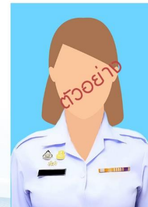
ทหารหญิง